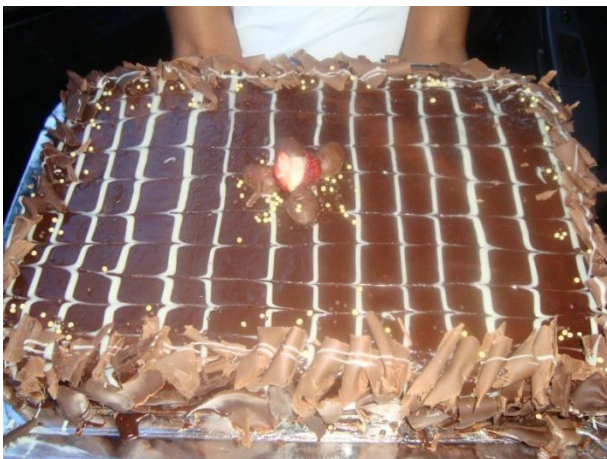
RASPAS DE CHOCOLATE