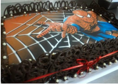
LATERAL DE FIOS DE CHOCOLATE