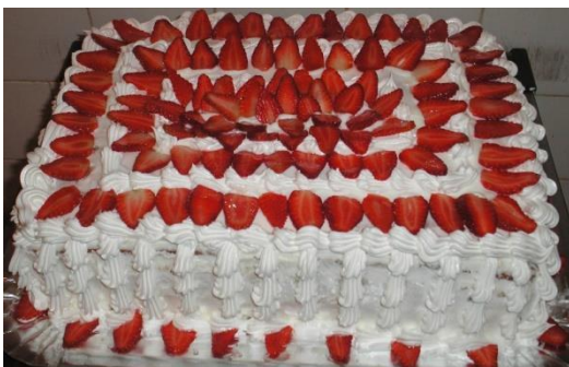
CHANTILLY COM MORANGOS