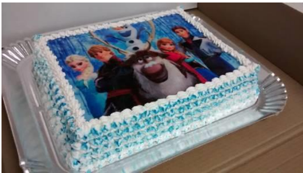
PAPEL DE ARROZ