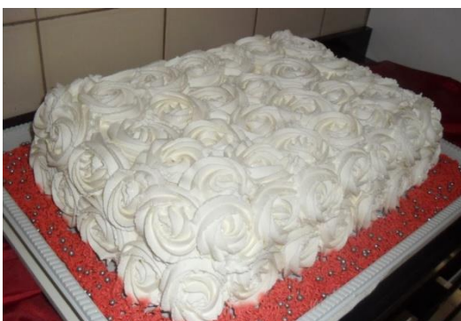
FLOR DE CHANTILLY